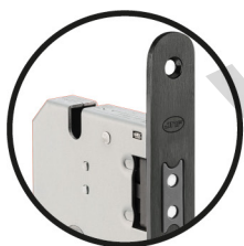
.TB TITANIUM BLACK

Outros acabamentos/ Other finishes/ Otros acabados