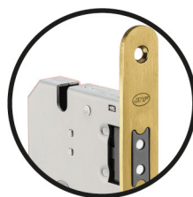
.TG TITANIUM GOLD