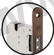
.TCH TITANIUM CHOCOLATE