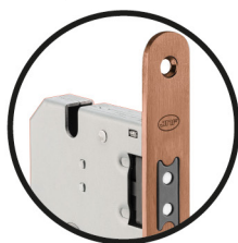
.TCO TITANIUM COPPER